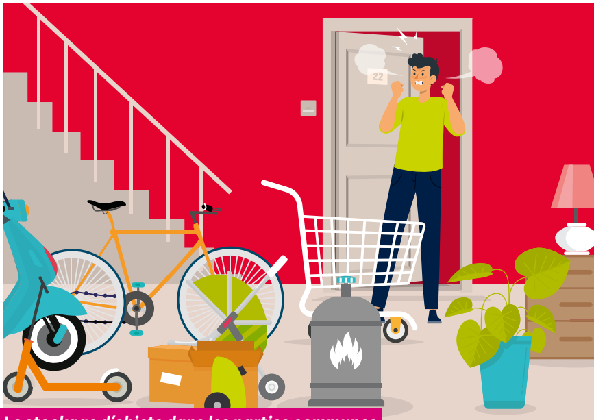
Le stockage d'objets dans les parties communes représente un danger : il est interdit.

De même, pour la sécurité de tous, le stockage d'objets quels qu'ils soient : les encombrants, mais aussi les poussettes, les vélos, les trottinettes, les scooters..., est interdit dans les parties communes.